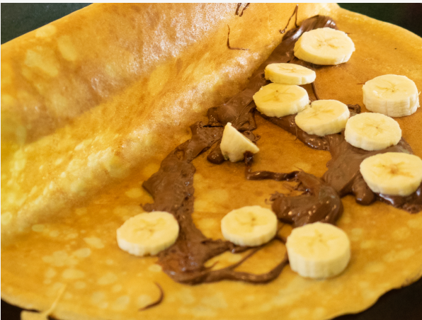
Nutella mit Banane