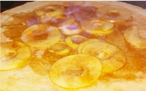
Frische Äpfel mit Zimt und Zucker, flambiert mit Calvados