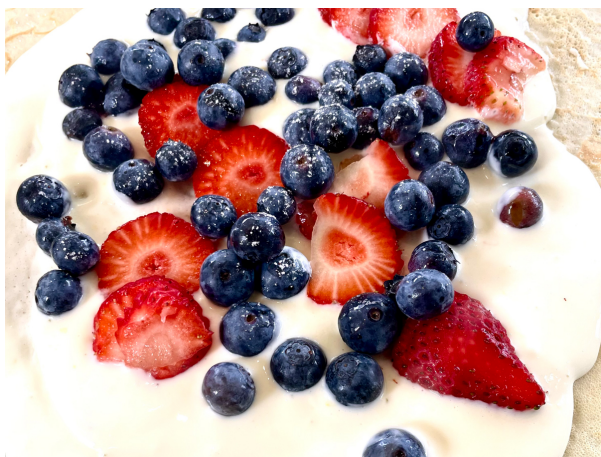
Frische Beeren oder Früchte der Saison auf Vanilleeis