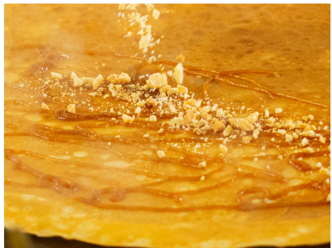
Hausgemachtes Caramel-Fleur-de-Sel mit karamellisierten Nüssen