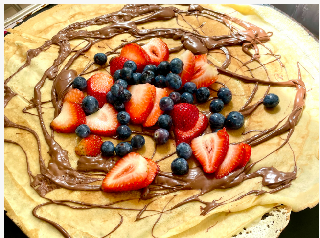
Frische Beeren oder Früchte der Saison auf Nutella