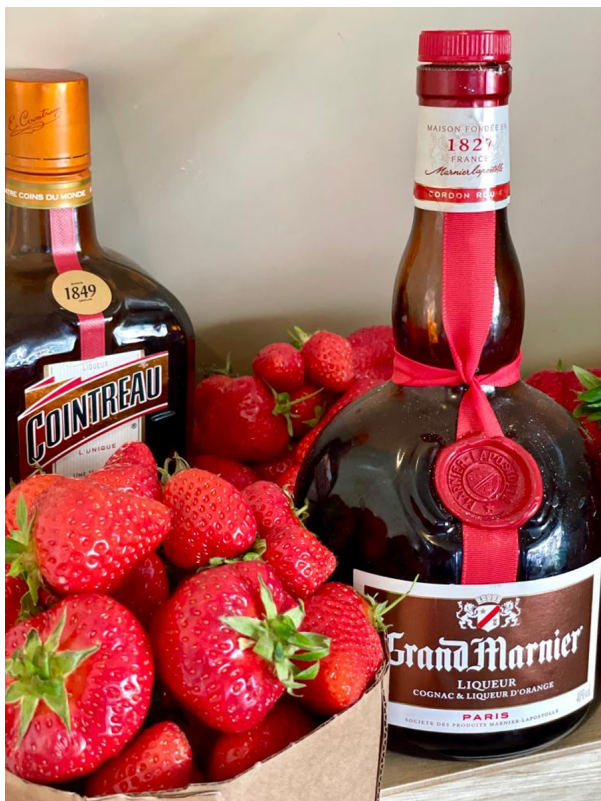
Crêpe flambiert mit Grand Marnier oder Calvados