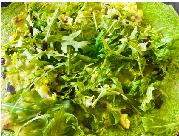
Grüner Kräutercrêpe mit Guacamole und Salat, nach Wunsch mit Käse oder Nachos ( + je 1,00 €)