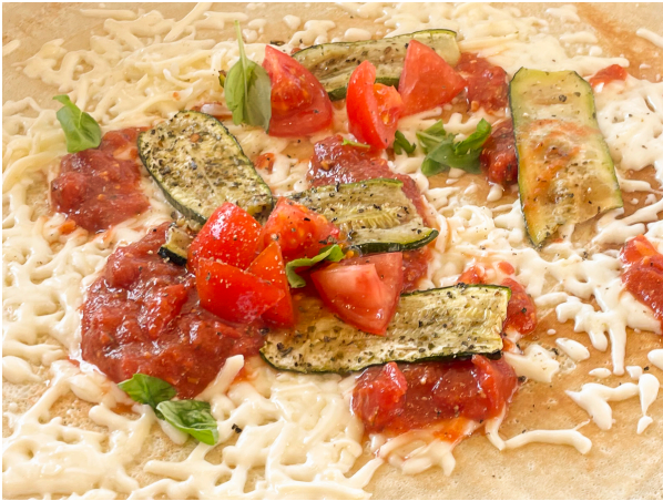
Mozzarella, Tomate und Rucola