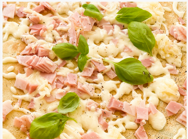
Schinken-Käse, nach Wunsch mit Rucola