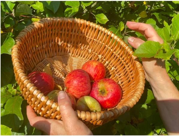
Apfelmus nach Wunsch mit Zimt und Zucker